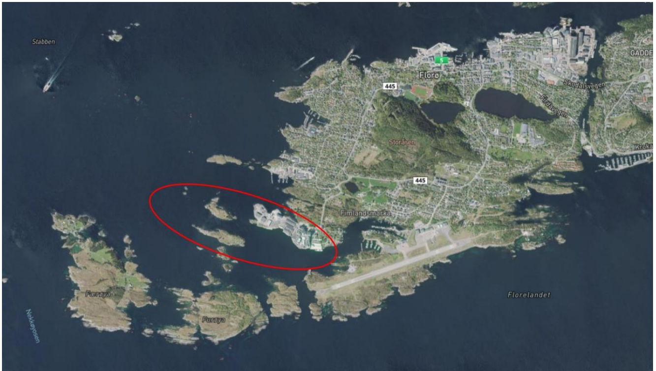
Figur 3: Oversiktsbilde for lokalisering av aktuelt planområde