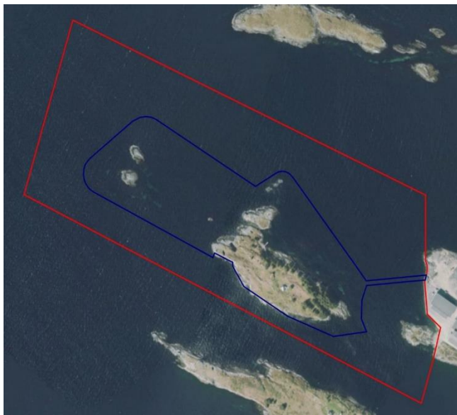
Figur 2: Varsla planavgrensing er markert i raudt. Blått omriss syner antatt landareal etter utfylling (iVest Consult)